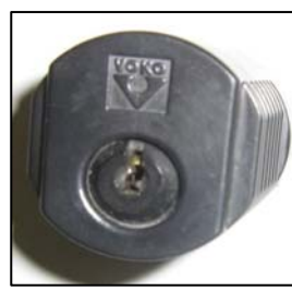
nicht mehr lieferbar