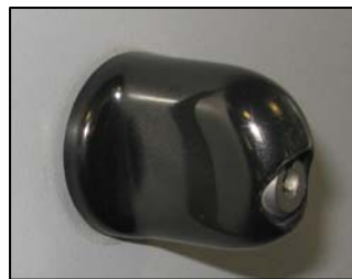
Dreholive in Schwarz oder Silber